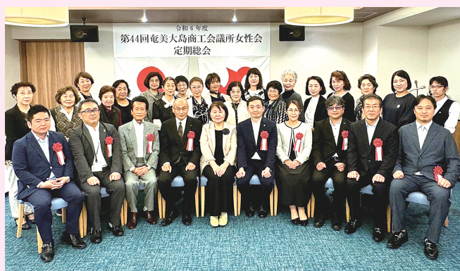
令和6年5月24日（金）奄美山羊島ホテル第44回奄美大島商工会議所女性会定期総会