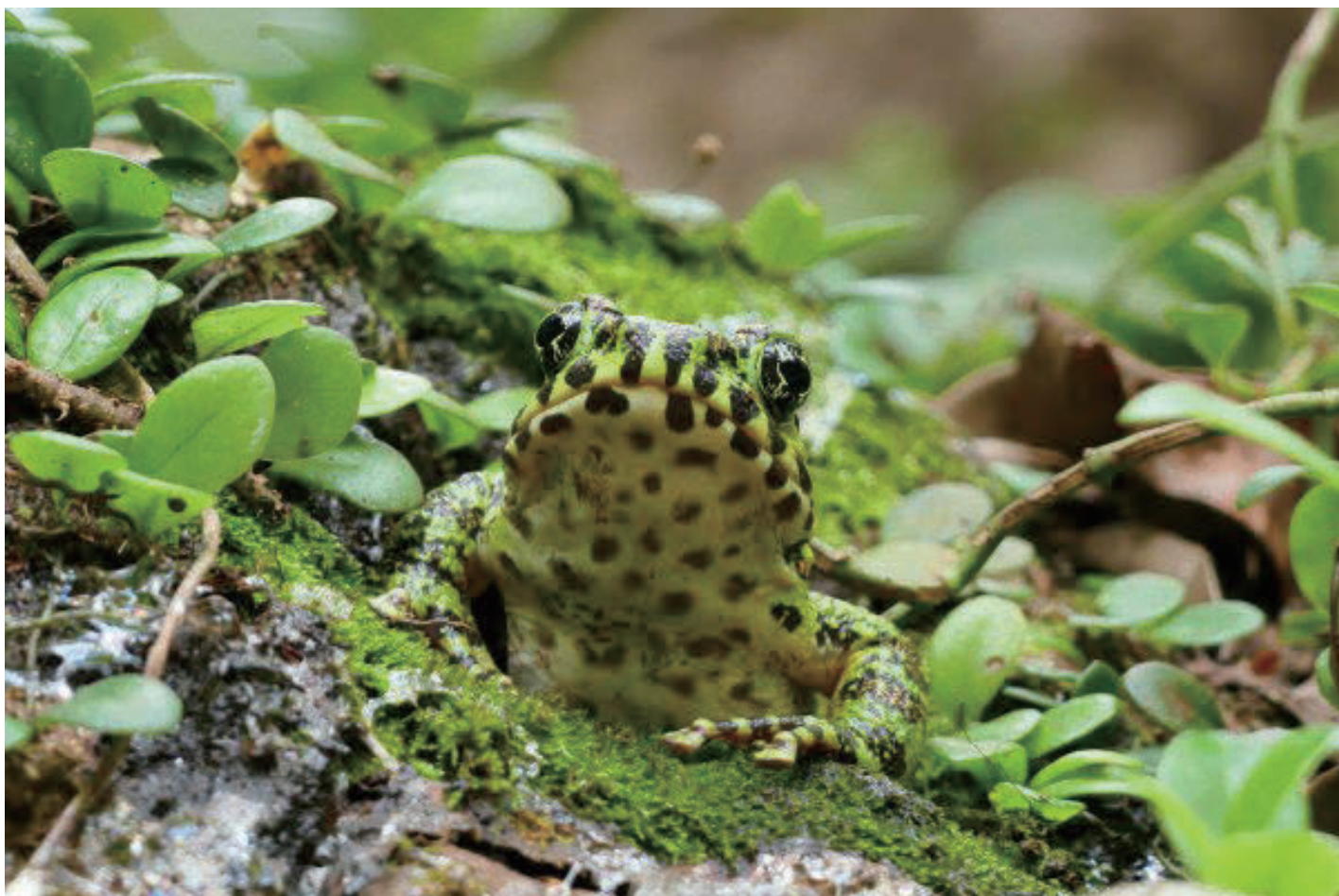
アマミイシカワガエル

URL: http://www.amami-cci.or.jp/ E-mail: amamicci@amami-cci.or.jp