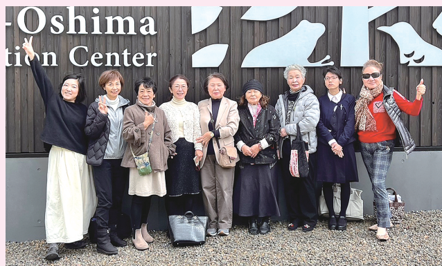
令和6年3月8日（金）奄美大島世界遺産センター「奄美大島商工会議所女性会研修会」

今年度も引き続き、各種事業を通して会員相互の交流や調和を図り、組織運営を強化しつつ、心豊かな地域社会の実現に向けて活動を行ってまいります。